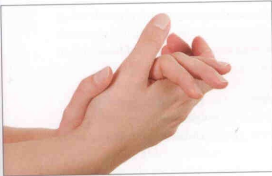
1. Hænderne gøres våde, og sæben fordeles.