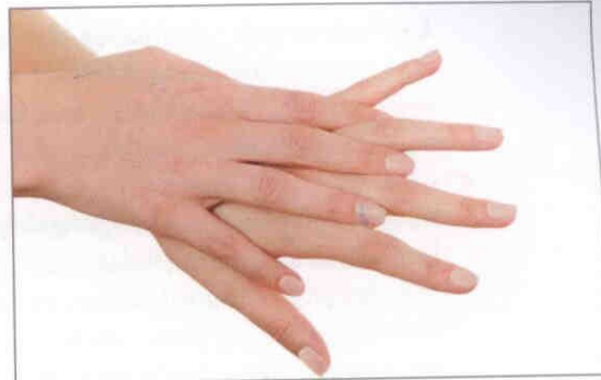
2. Håndryg og finger-mellemrum vaskes på begge hænder.