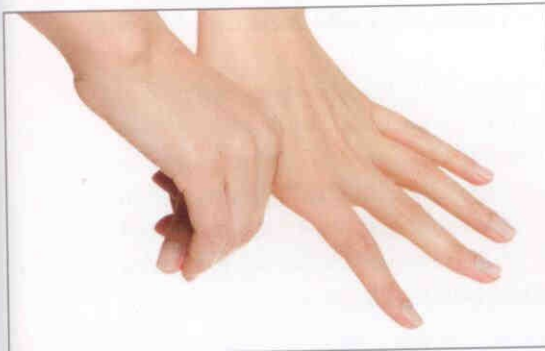
5. Tommelfingerens bagside vaskes på begge hænder.