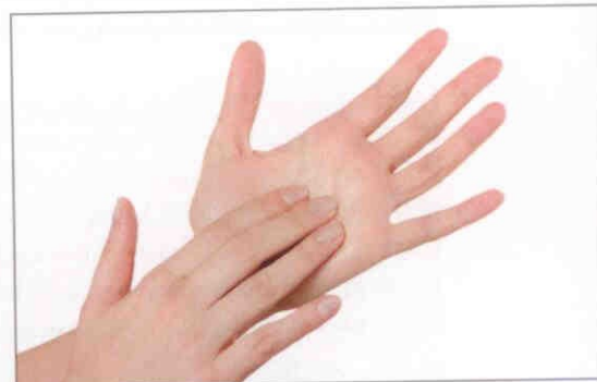
6. Håndfladernes furer vaskes på begge hænder.