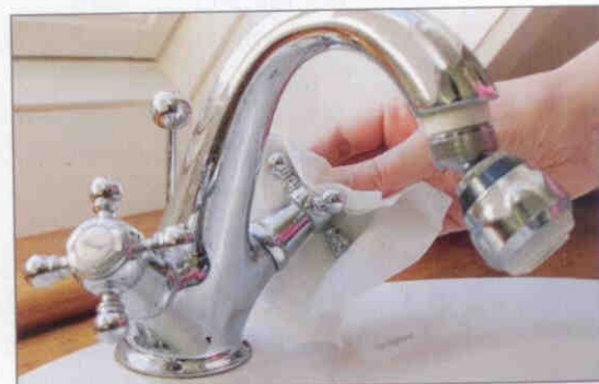
8. Vandhanen (urent område) lukkes med engangshåndklæde.