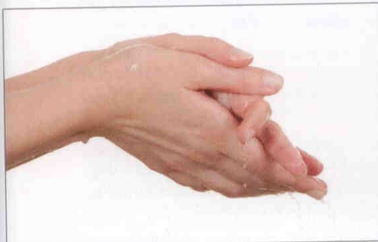
7. Sæberester skylles omhyggeligt af.