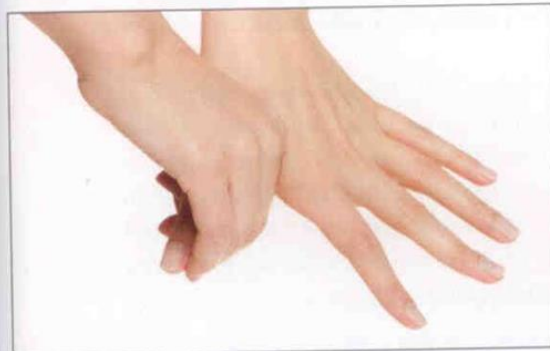
5. Tommelfingerens bagside vaskes på begge hænder.