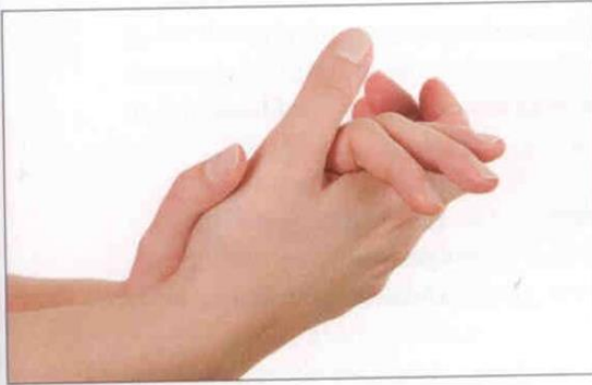
1. Hænderne gøres våde, og sæben fordeles.