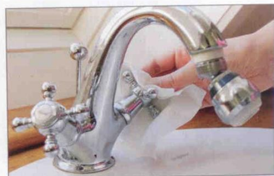
8. Vandhanen (urent område) lukkes med engangshåndklæde.