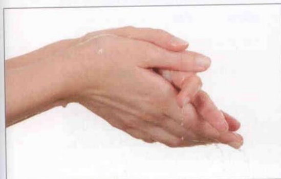
7. Sæberester skylles omhyggeligt af.