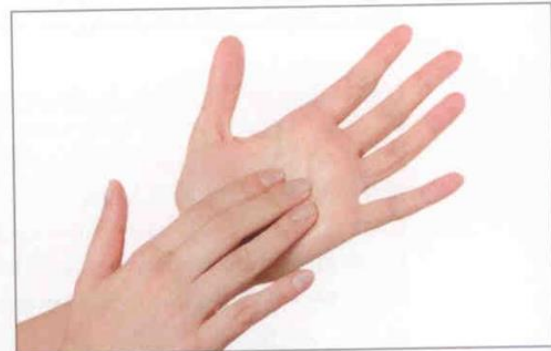
6. Håndfladernes furer vaskes på begge hænder.