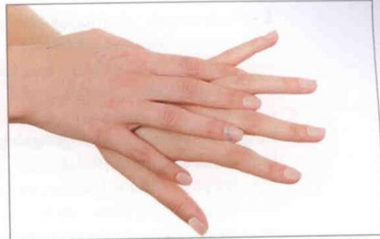
2. Håndryg og finger-mellemrum vaskes på begge hænder.